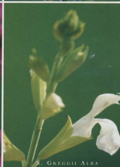
S. GREGGII ALBA

erra, consente di avere fioriture continue nei 12 mesi dell'anno