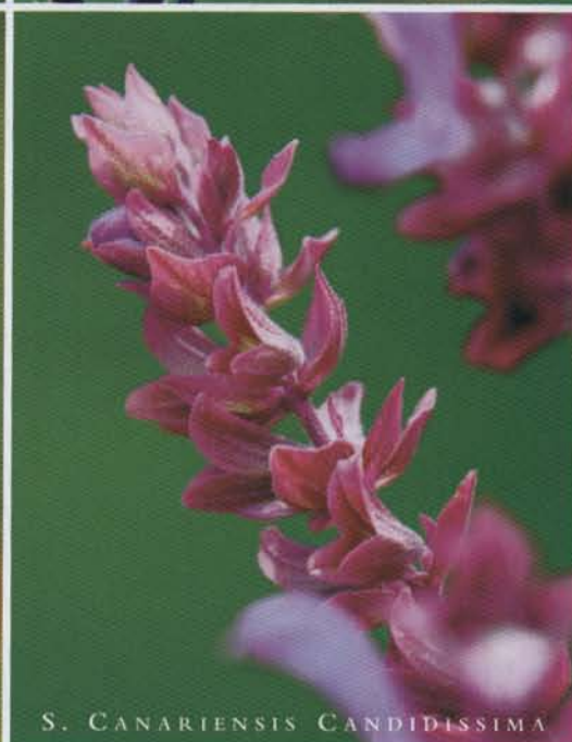
S. CANARIENSIS CANDIDISSIMA