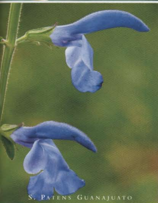
S. PATENS GUANAJUATO